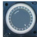
programmierbare 24 h Zeitschaltuhr