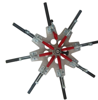
OSMA Drehteller für 8 Atemschutzmasken